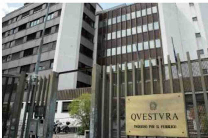
Viale Mazzini La questura è sotto organico da tempo