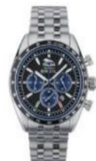
POLICE CHRONO 43 MM

Compariranno i due modelli di orologio e cliccando sul prodotto scelto verrete direttamente indirizzati alla scheda prodotto.