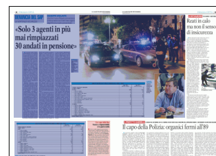
TABELLA/2 Il dato relativo alla delittuosità in tutta la Capitanata