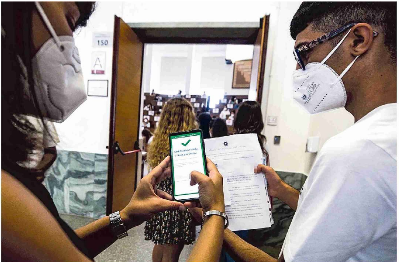
Il governo si prepara a estendere l'obbligo del certificato verde per nuove categorie di lavoratori